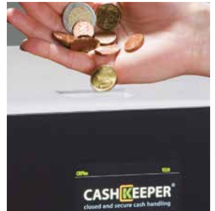
Acepta, valida, recicla y paga todas las monedas