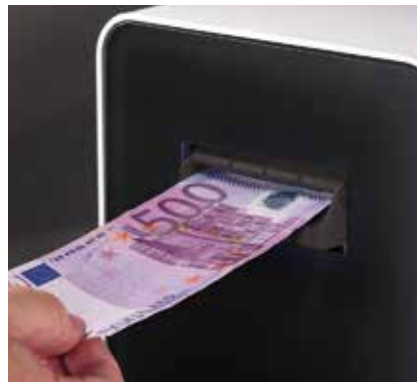
Acepta y verifica todos los billetes, incluyendo el de 500 €