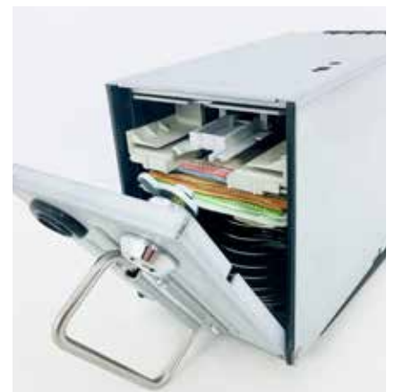
Recaudación de billetes en un módulo cerrado. Nadie ve ni toca el dinero